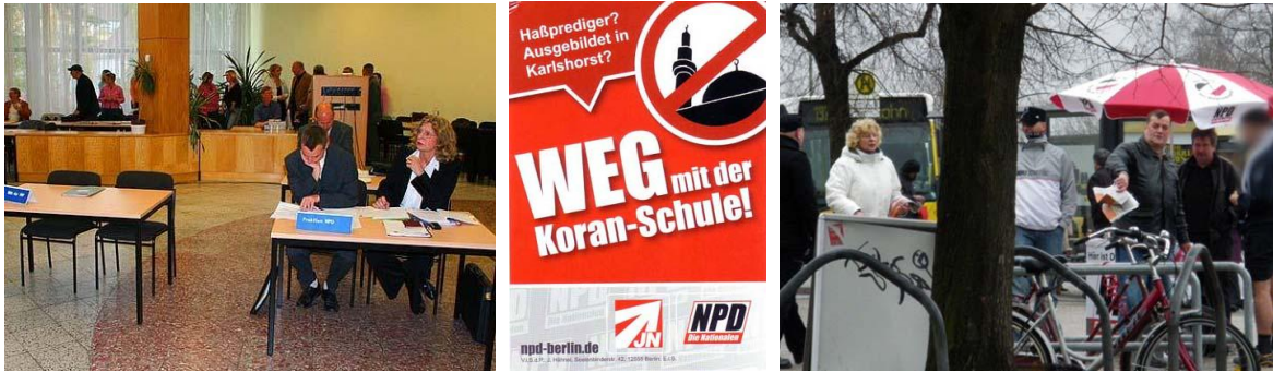
(Bild 1: NPD-Fraktion in der BVV, 26.10.2006, Bild 2: NPD-Aufkleber in Karlshorst, Bild 3: NPD-Stand am S-Bhf Friedrichsfelde Ost, 07.03.2009,)