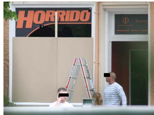
(Bild 1: Internetseite des Klubs Walhalla 92, Bild 2: Laden „Horrido“ am 8. Mai 2009)