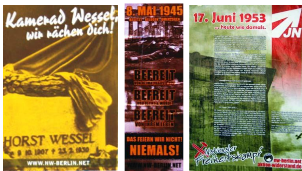
(Bild 1: Aufkleber zum Todestag des SA-Sturmführers Horst Wessel, Bild 2: Plakat zum „Tag der Befreiung“, Bild 3: Plakat zum „Volksaufstand am 17. Juni“)

Als „Freie Kräfte“ werden Rechtsextreme verstanden, die sich abseits der Parteien NPD und DVU in Kameradschaften oder losen Zusammenhängen organisieren. Seit dem Verbot der Lichtenberger „Kameradschaft Tor“ (2005) ist das Internetportal „NW Berlin“ zentrales Projekt der Lokalen „Freien Kräfte“.